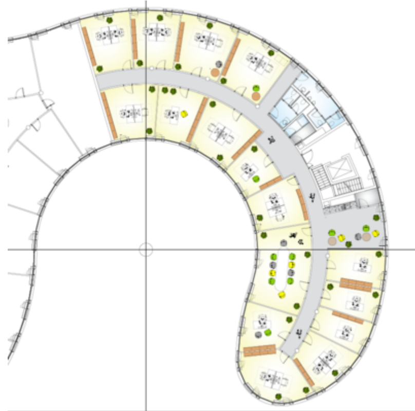
Gebäude C - 4. Stock